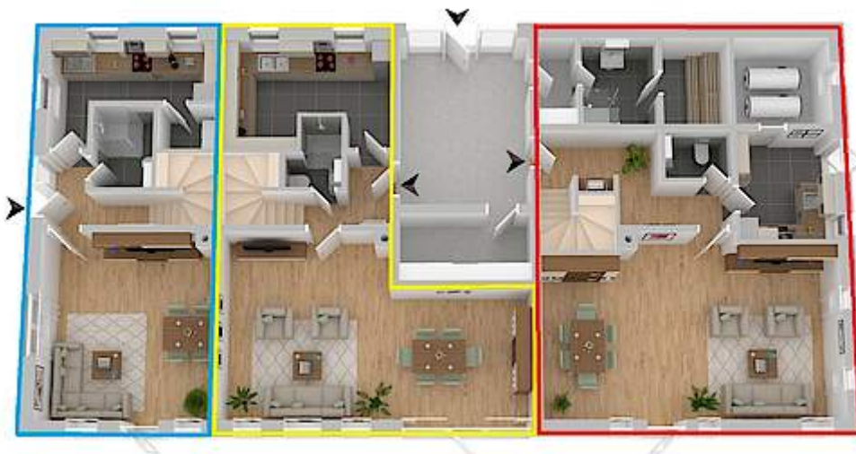
Erdgeschoss (ehemalige Scheune)