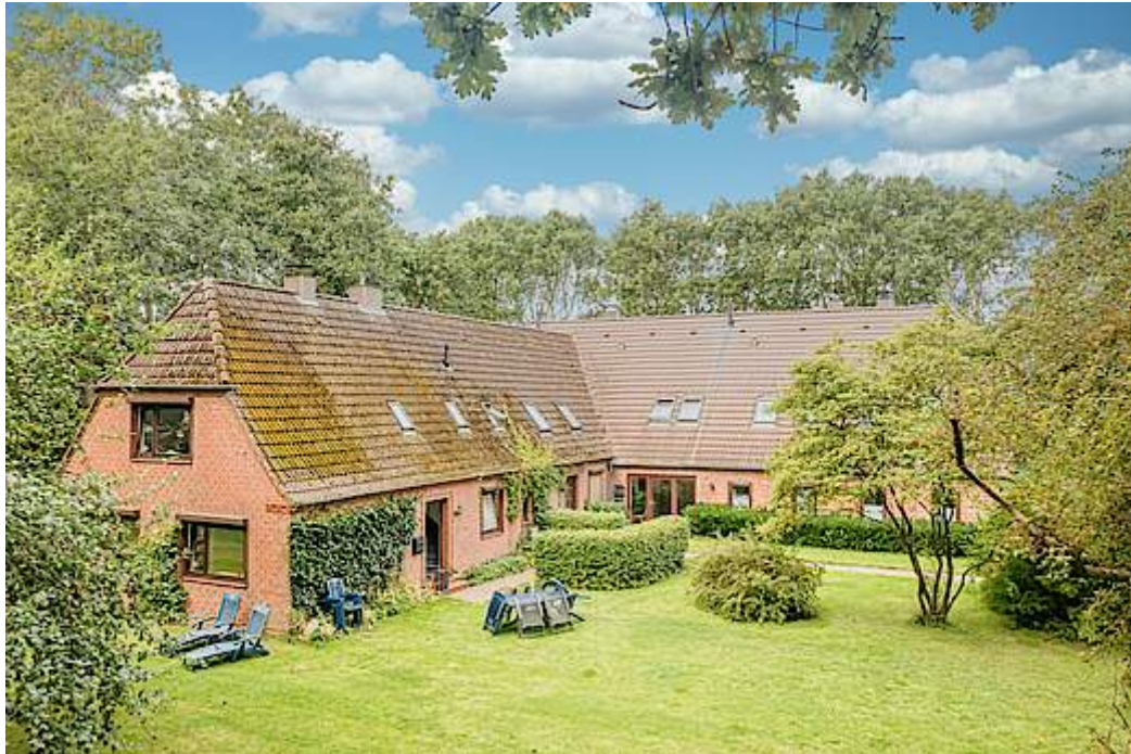
Mit fünf Wohneinheiten